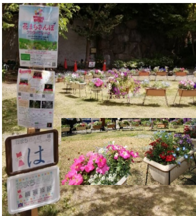
孝道山 おもしろ花壇

「孝道山おもしろ花壇」のお花を育てて、手入れしているご信徒の皆さまありがとうございます！