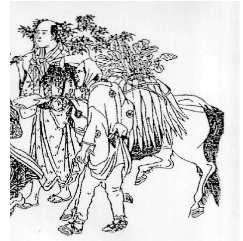
馬の背にたくさんの大根を載せ、 大根売りが行く。初冬の一時。 「四時交加」寛政10年(1798)