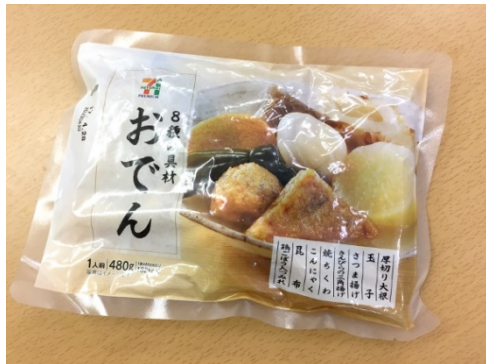
便利なパック入りのおでん