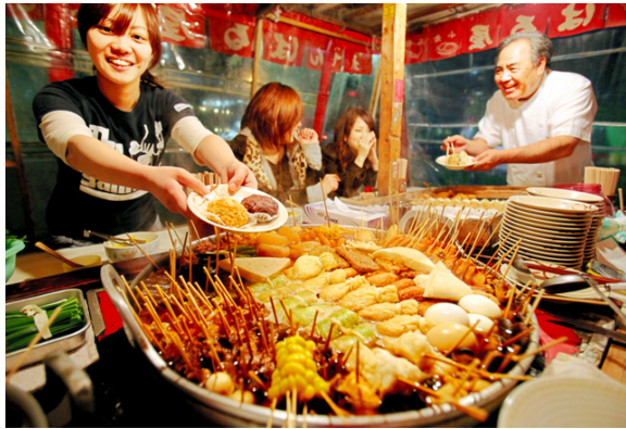
おでん屋台の味、女子大生が継ぐ週 1度カフェで開店 朝日新聞デジタル