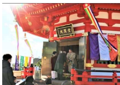
宝蔵大黒天福德結縁

新年を迎えるにあたり、個人、家族、会社の「新年特別修祓」を行います。この「修祓」は、息災・招福を祈願すると共に、各自が心を清浄にして仏縁を深め、自分の立てた目標に向かって精進する力を頂く尊い法儀です。