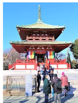
仏舎利殿ご開帳 蓮華宝塔ご開扉

宝蔵大黒天福德結縁は結婚、恋愛のみならず、子宝のご縁、入学のご縁、就職のご縁、商談のご縁、人とのご縁など、皆様に幸福を呼び込みます。