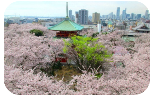
孝道山山頂の満開の桜