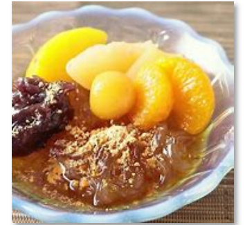
あんみつ風ところてん