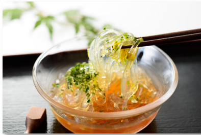
酢醤油ところてん