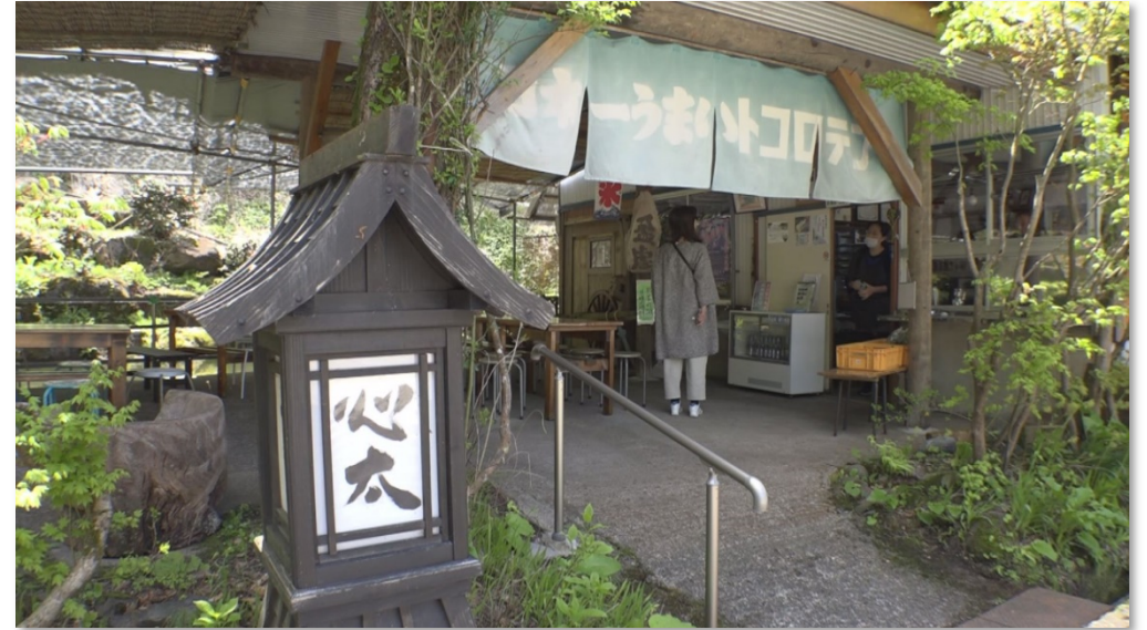
新潟県上越市大島区にある「日本一うまいトコロテン」