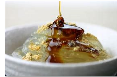
きな粉黒蜜ところてん