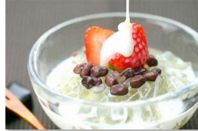
練乳イチゴところてん